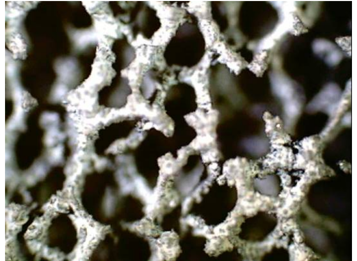
발포금속에 적용된 SEM 40X Catalyst